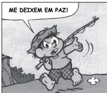
Disponível em: https://pt.quora.com . Acesso em: 17 jul. 2024 (adaptado).