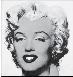
WARHOL, Andy. Shot Sage Blue Marilyn . 1964. Disponível em: https://www.latimes.com . Acesso em: 17 jul. 2024.

A Pop Art buscava evidenciar a crise da arte do século XX. Essa expressão artística recusava a separação entre