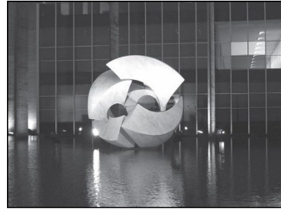
Meteoro (1967), de Bruno Giorgi. Brasília, D.F.

Nessa escultura de mármore, de linhas curvas e retas, existem volumes e espaços vazios. Graças a essa composição, o objeto parece flutuar no espelho-d'água, o que gera uma